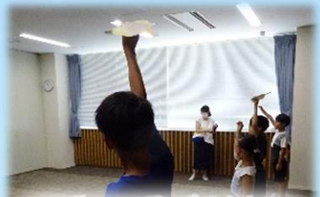
作って飛ばそう! むささびグライダー