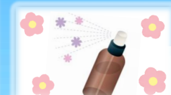
かおりの話 ~ルームスプレーを作ろう~