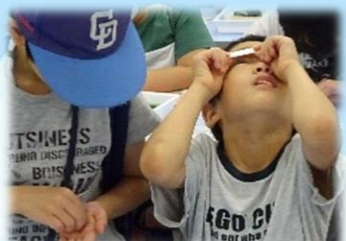
カード型顕微鏡を作ろう!