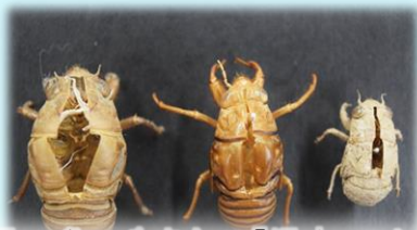
世界一多い生きもの「昆虫」のヒミツ ~残された手掛かりから正体をあばけ!~