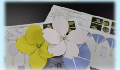
花のつくりってどうなっているの? 花の模型を作ってみよう!