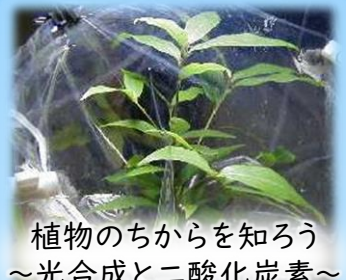
植物のちからを知ろう ~光合成と二酸化炭素~