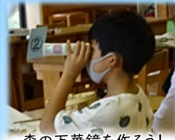
森の万華鏡を作ろう!