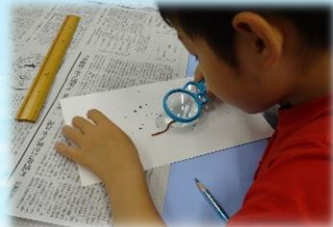
ほんとはスゴイ!ミミズのヒミツ