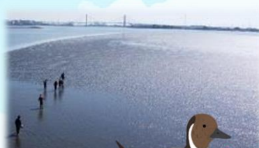
干潟の魅力を知ろう!