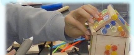
プラスチックからできている 接着剤・粘着剤の不思議