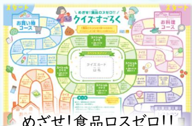
めざせ!食品ロスゼロ!! クイズすごろくで遊ぼう