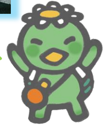
水質パトロール隊 PR キャラクター かっぱとくん

見慣れた川でも 新しい発見が 出来ちゃうかも！ みなさんのご参加 お待ちしております