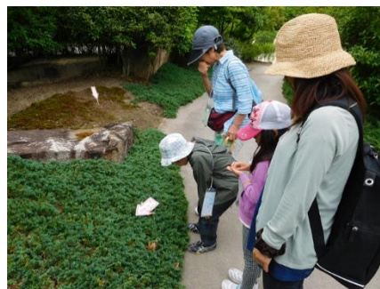
生き物を探す参加者の様子

( http://www.pref.aichi.jp/soshiki/kankyokatsudo/h30osanpo.html )