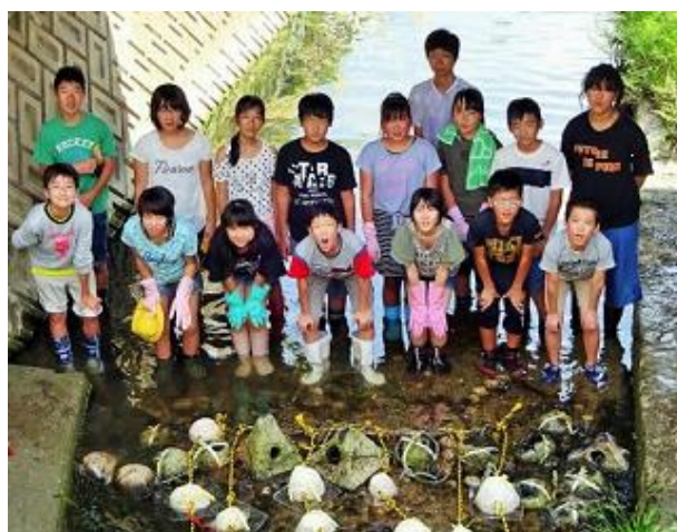
水質パトロール隊の参加者を募集しています (P3)