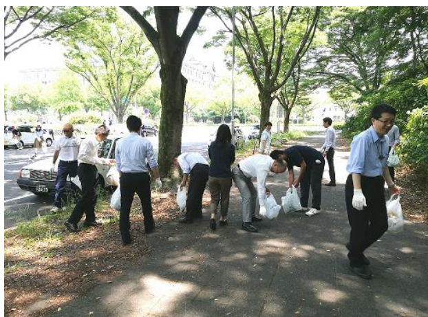
ごみ散乱防止キャンペーンを実施します (P3)