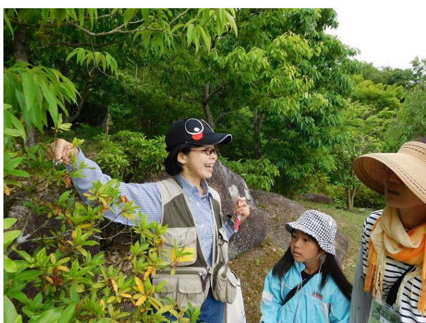
「おさんぽ de いきものみつけ」を開催します (P2)