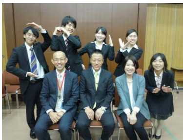
チーム・ソニーイーエムシーエス