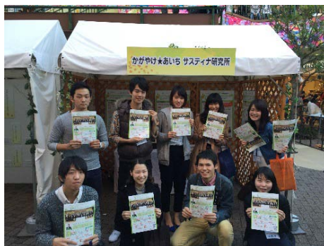
ブースでの成果発表