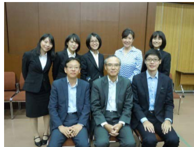
チーム・東邦ガス