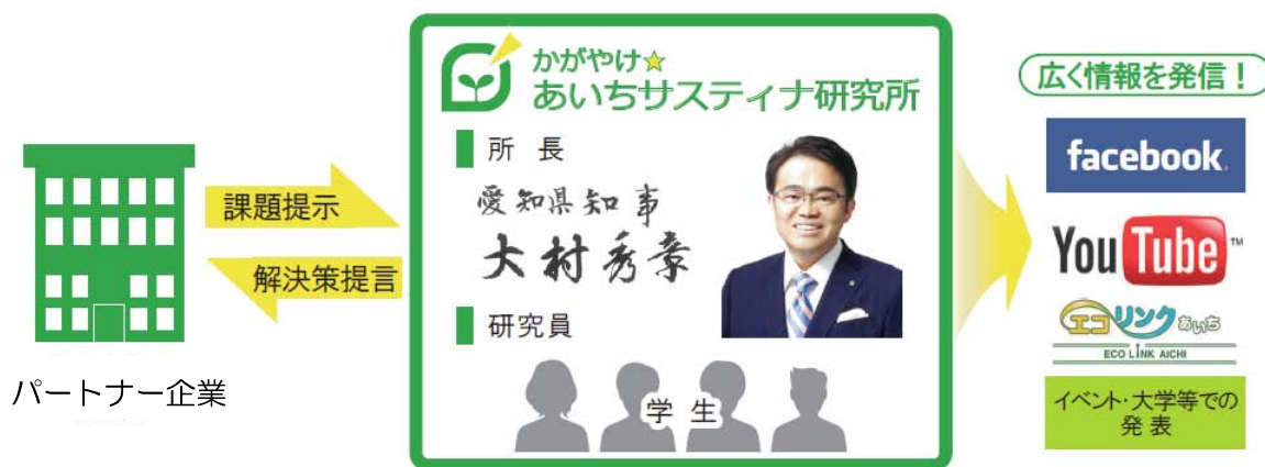
かがやけ☆あいちサスティナ研究所の概要

として活動しました。5社のパートナー企業から環境面での取組に関する課題を提示され、研究員4名が1チームとなって、各パートナー企業の現場での調査や企業の担当者とのディスカッションを経て、解決策を研究するとともに、その成果をYouTubeなどのSNSや「エコリンクあいち」、イベントを通じて広く発信しました。