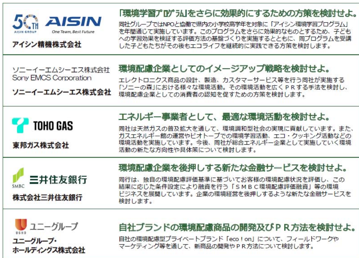
パートナー企業と研究課題

であり、各企業が実施している環境に関する取組について魅力的な課題が提示されました。