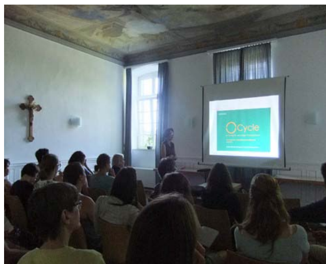
プレゼンテーションを熱心に聴講する学生

* デザインガイドとは、ワークショップの各テーマを議論するに当たり、事前に学習する教科書のこと。