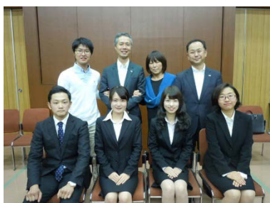
チーム・三井住友銀行