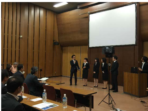
チーム・三井住友銀行