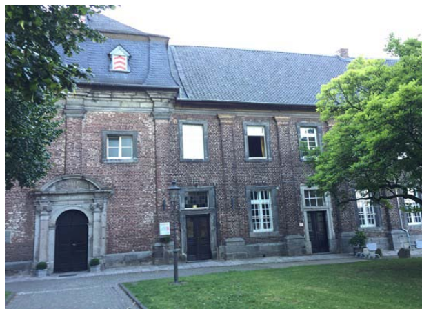
第7回サステイナブルサマースクールの会場 (NIKOLAUS KLOSTER)

このサステイナブルサマースクールは企業と連携して取り組まれており、ドイツ国内の企業に対しても発表の場が用意されるなど、より多くの人にその成果を発信することで、持続可能な社会づくりに向けた取組を多様な主体に浸透させることに貢献しています。