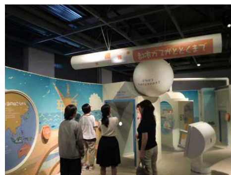
チーム・東邦ガス