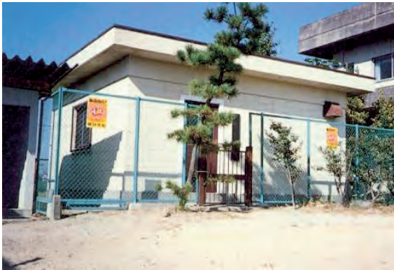
図 7-2-2 地盤沈下観測所