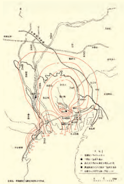
図 7-1-1 尾張・名古屋市地域の海拔ゼロメートル地帯及び累積沈下量の状況 (昭和 36 年～平成 22 年)