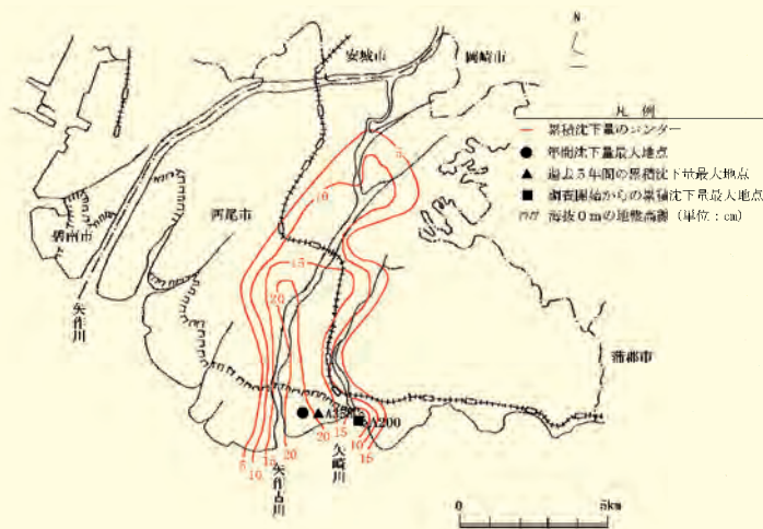
図 7-1-2 西三河地域の海拔ゼロメートル地帯及び累積沈下量の状況 (昭和 50 年～平成 22 年)